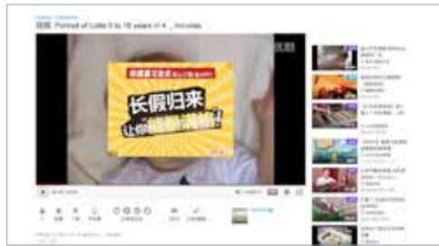
Ruimte voor een fotobijlschrift

het maar gewoon doen. Het is dan ook een soort mijlpaal. De basisschoolperiode is afgelopen en de middelbare schooltijd breekt aan. Een dag nadat ik het gepost had, ontstond er een explosie. Werkelijk. Ik heb daar de kracht en de macht van social media gezien. Ongelooflijk. Het was gek genoeg eerst in