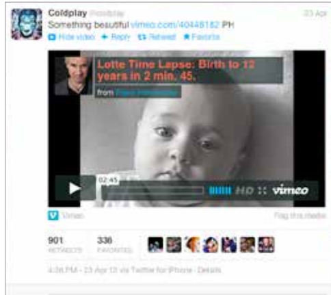
Ruimte voor een fotobijlschrift

Amerika, niet eens hier in Nederland. Ik was al bij CNN, NBC en ABC geweest voordat ik een telefoontje kreeg van de Stadsomroep Utrecht. “Goede-middag meneer, we hebben begrepen dat u iets bijzonders heeft gemaakt.” Toen kwam ook al snel de Wereld Draait Door. Dat gebeurde in een week van maandag tot vrijdag. Een krankzinnige week.’